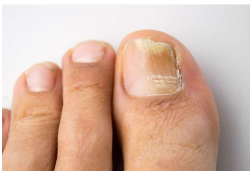
glivična okužba nohtov